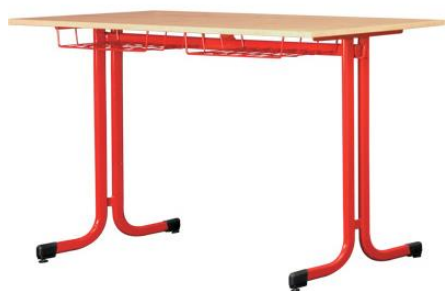
Typ FMS010 - 2