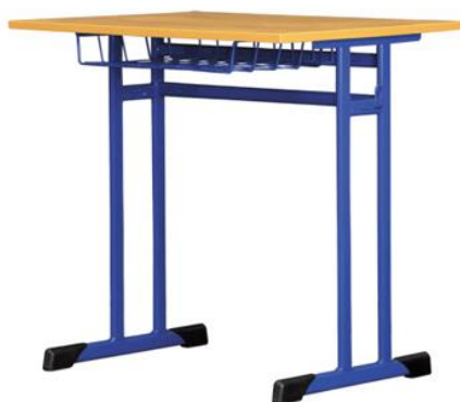
Typ FMS020 – 1